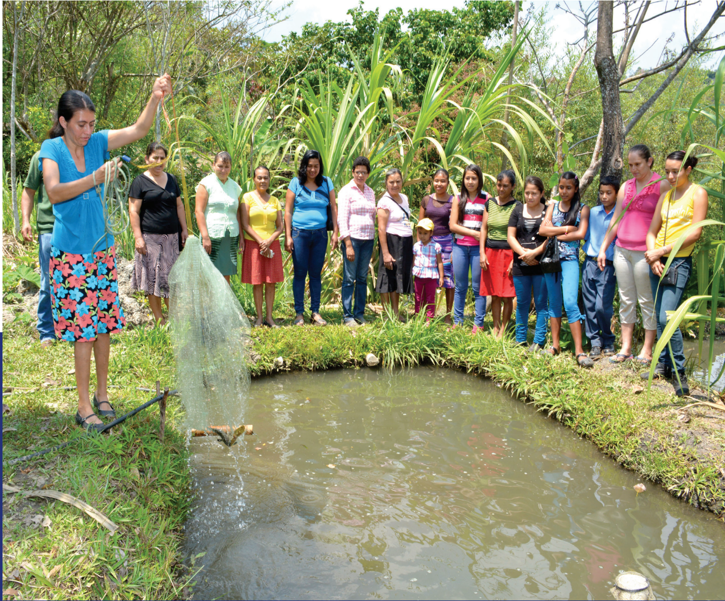
CADER de mujeres, Granados, Baja Verapaz.