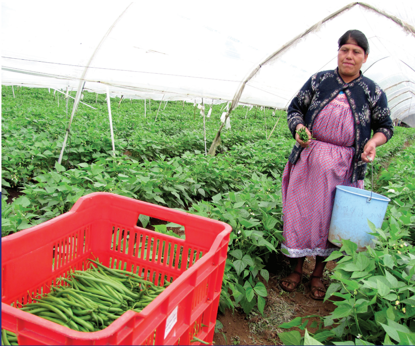
Cultivo de ejote francés. Tactic, Alta Verapaz.