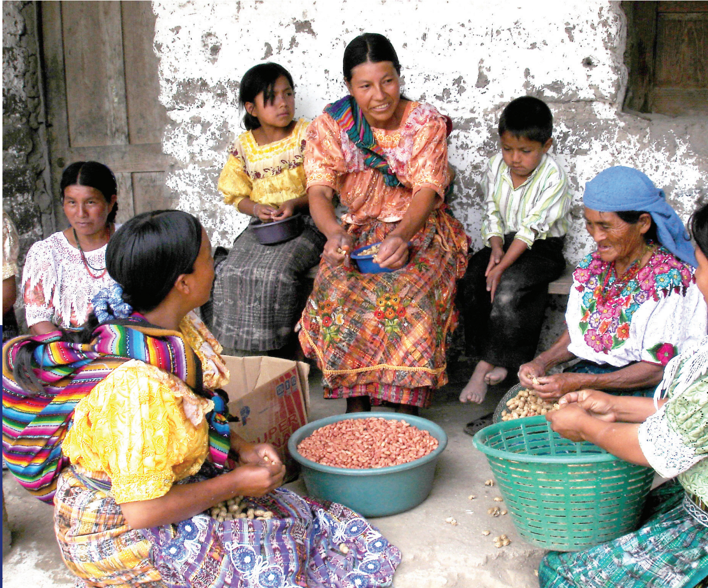
Mujeres cosechando maní.