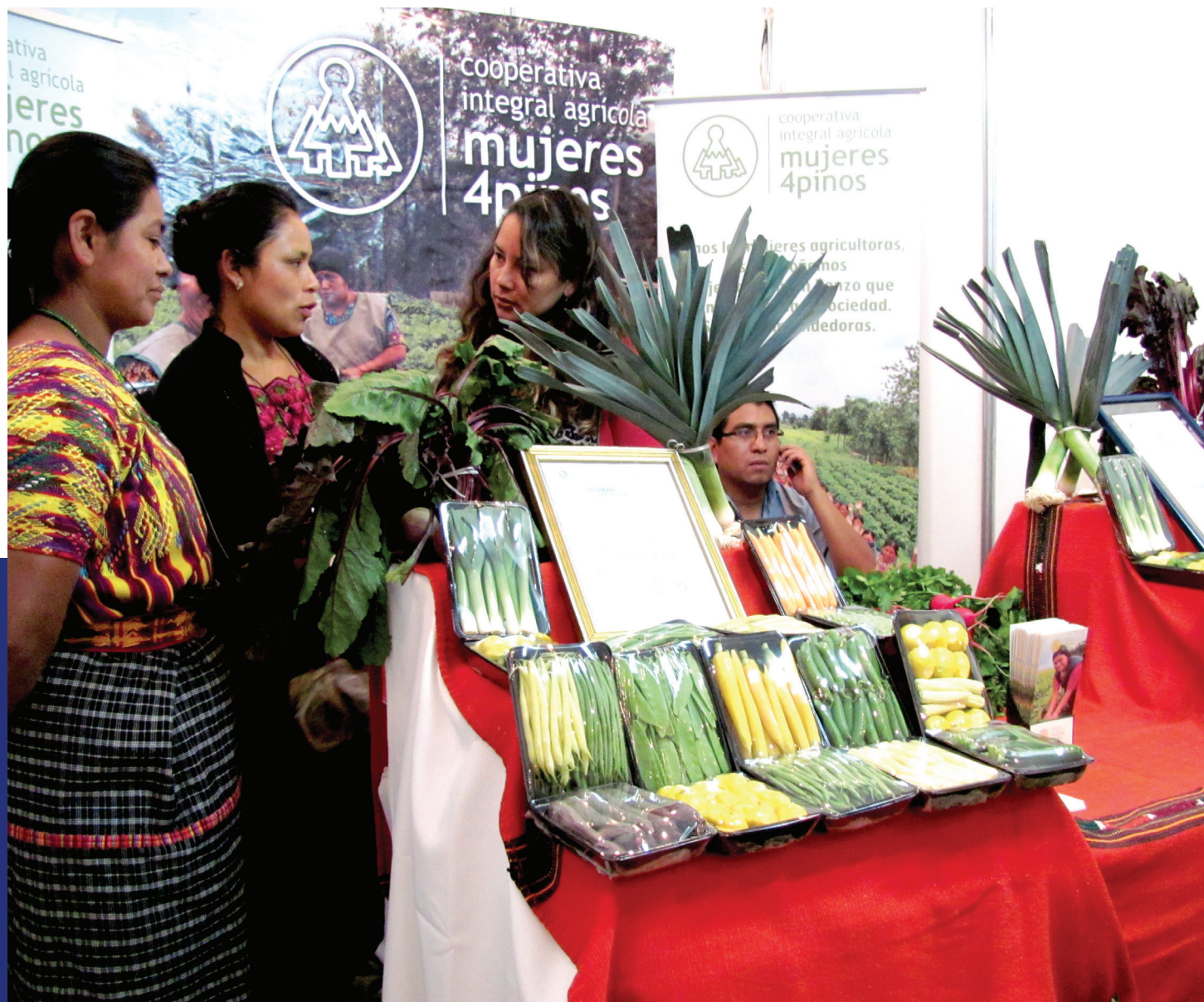
Cooperativa integral agrícola "Mujeres 4 pinos"