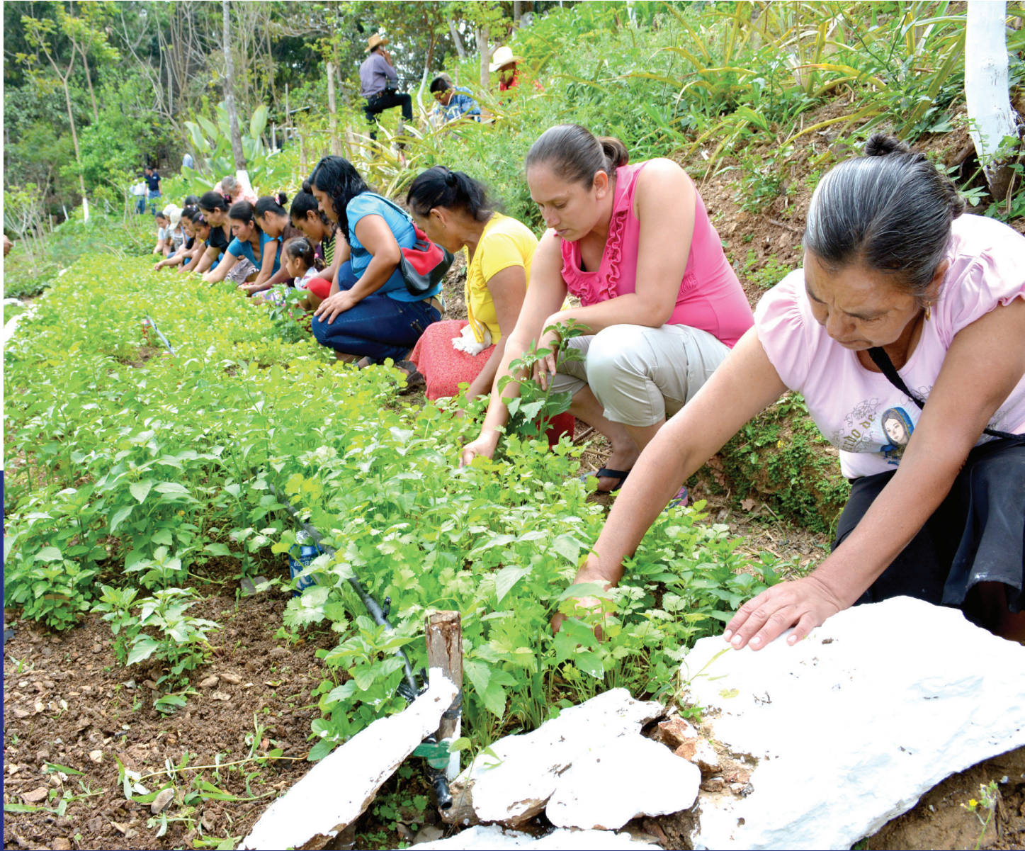
Cultivo de cilantro en barreras vivas CADER, Granados, Baja Verapaz